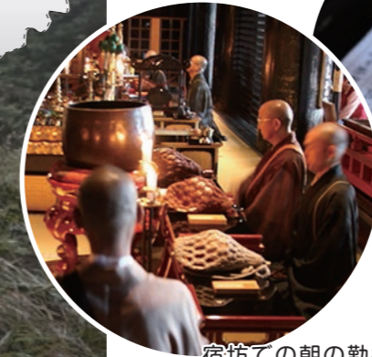
宿坊での朝の勤行

吉野山の金峯山寺や高野山の宿坊（宿泊者限定）で毎朝行われ、勤行や、大峯山の修行、写経、瞑想などが体験できます。