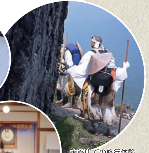
大峯山での修行体験